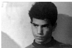
Cas n°1, cas n°2

À 20h30 : Projection de Hommage aux professeurs (1977) et Cas n°1, cas n°2 (1979) animée par Frédéric Sabouraud en présence d'Abbas Kiarostami